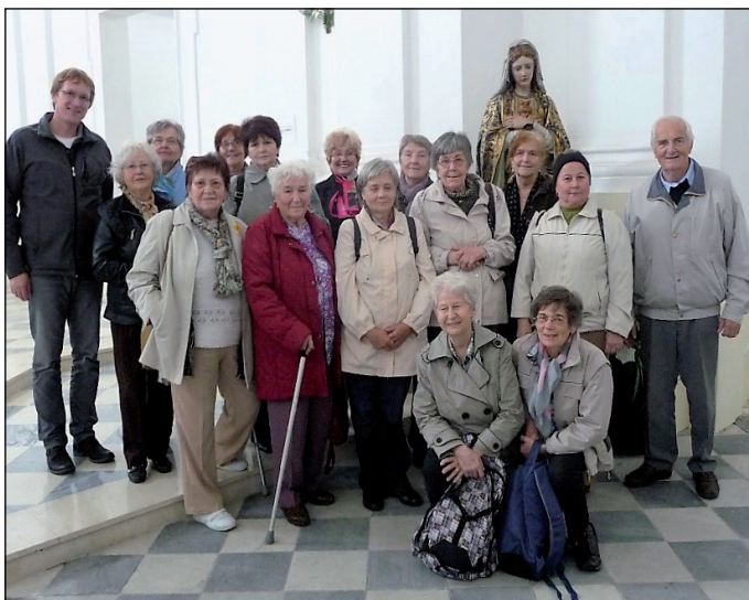
Klub sv. Anežky pořádá zajímavé výlety, zde na Uhlířském vrchu v Bruntále.