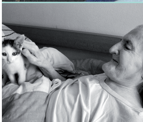
1. kategorie: Portrét Lidé Charity a jejich tváře

Patronát nad soutěžní kategorií pro klienty převzala firma ASEKOL.