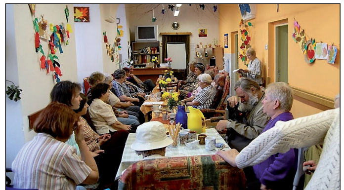
Dvě historické fotografie z původního sídla na Masarykově třídě ještě z časů dobrovolnického sdružení, které bylo později jedním z pilířů vzniku Klubu sv. Anežky.