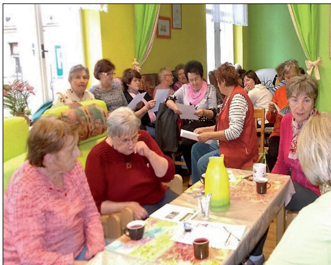
Během oslav výročí deseti let klubu zde bylo opravdu velmi živo.