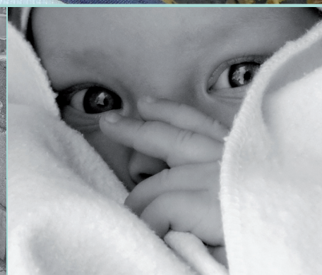
3. kategorie: Jak to vidím já Jak vidí Charitu její klienti