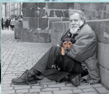
2. kategorie: Život kolem nás Jak vidí Charitu její zaměstnanci a dobrovolníci