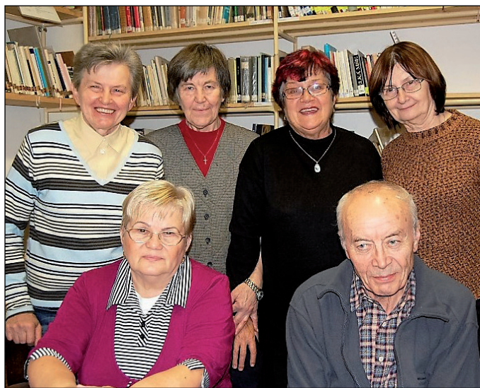
Někteří z dobrovolníků, kteří se už roky starají o Knihovnu křesťanské literatury..