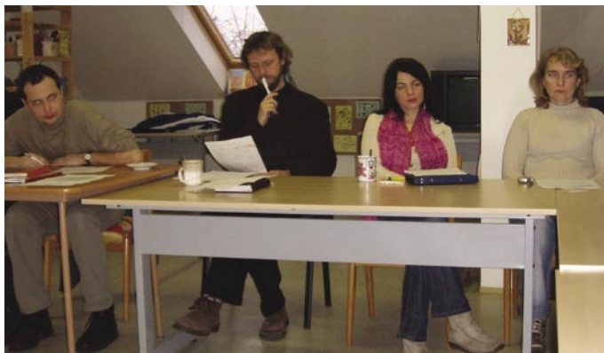
Vedoucí skupinek strategického plánu 17. prosince na poradě na ředitelství v Jaktarži.

Jak jsme již informovali v předchozím čísle Domovníku, v Charitě Opava se v těchto dnech připravuje strategický plán organizace. Na konci ledna 2008 Charita Opava svoji vizi představí zřizovateli, kterým je biskup Diecéze ostravsko-opavské.