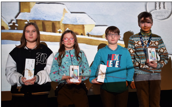
...a ti starší mohli vyhrát zajímavou elektroniku a mobilní telefony.