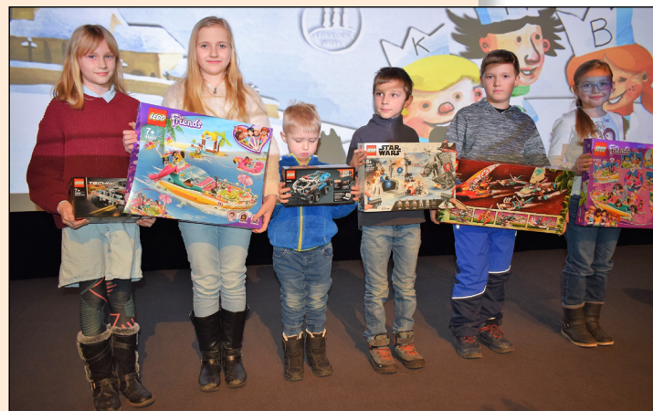
Na menší děti čekala jako odměna stavebnice LEGO...