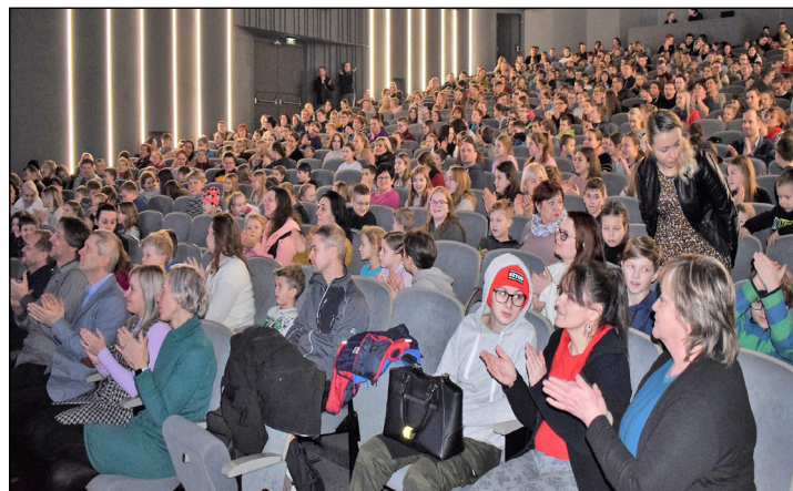
Kino MÍR bez nadsázky praskalo ve švech!