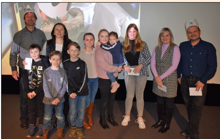
Takto se usmívali vítězové soutěže o nejlepší tříkrálové foto.

tři poukazy do charitativního wellness centra jako odměnu za práci koordinátorů v obcích a zasloužilých koledníků z řad dospělých. „Za to, jak se do sbírky zapojují, by si ur-