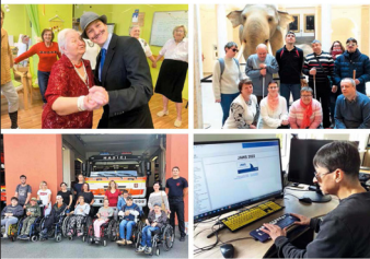
Výroční zpráva 2022 Charita Opava