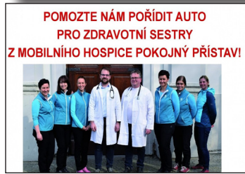
POMOZTE NÁM POŘÍDIT AUTO PRO ZDRAVOTNÍ SESTRY Z MOBILNÍHO HOSPICE POKOJNÝ PŘÍSTAV!

● O pomoc se na veřejnost obrátil mobilní hospic Pokojný přístav. Aby hospic vyhověl všem žádostem a nemusel odmítat klienty, přijal do svého týmu novou zdravotní sestru. Ta ale nutně potřebovala automobil, na jehož pořízení jsme neměli finance. Následovala velká vlna solidarity a krásných gest lidské vzájemnosti. Za několik týdnů se na účtu Pokojného přístavu nasbíralo neuvěřitelných 510 tisíc korun. Kromě posílání peněz na účet Pokojného přístavu lidé na několika místech spontánně vybírali peníze mezi sebou v práci nebo uspořádali bazar, jehož výtěžek věnovali mobilnímu hospici. „ Tento nádherný výsledek svědčí také o tom, že náš mobilní hospic má u veřejnosti velmi dobré jméno, “ poděkoval všem dárcům ředitel Jan Hanuš.