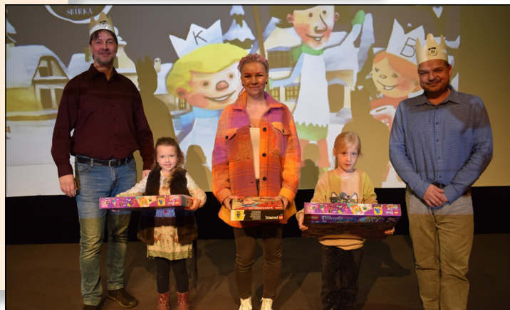
Stavebnice Lego si odnesli nejen vylosování koledníci z osudí...