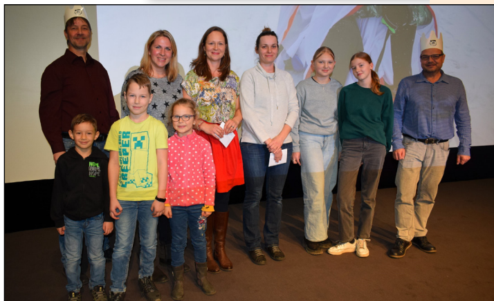
S porotci se vyfotili někteří vítězní autoři fotosoutěže i s koledníky.

Pak byli chvíli v napětí ti, kteří poslali své fotografie do soutěže o nejlepší tříkrálové foto. Ty