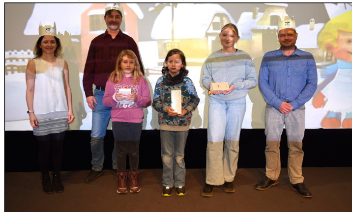
Elektronika je cennou výhrou, ale tou hlavní je radost z pomoci.