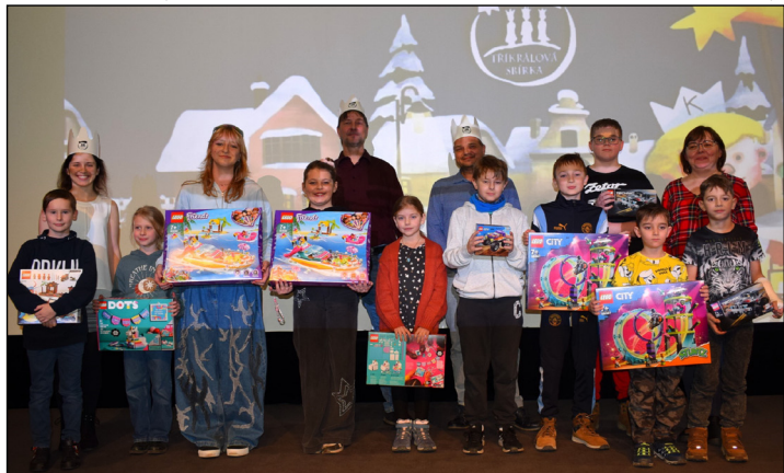
...ale díky sponzorům i koledníci vylosování z přítomných v sále.