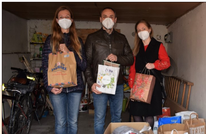
Sbírka se nazastavila ani v čase epidemie covidu.

Přiznám se, že si žádné ekonomické statistiky nevedeme. Můžeme si však společně udělat alespoň hrubý odhad. Před každou postní sbírkou sdělujeme občanům také doporučenou částku, kterou může každý potenciální dárcce do nákupu potřebného zboží investovat. Začínali jsme na sto korunách, letos už to bylo od sta do dvou set korun. Realita ukázala, že většina dárců nakonec stejně daruje zboží ve větší hodnotě, někdy i násobně vyšší. Vzhledem k počtu dárců a množství darovaného zboží tak odhaduji hodnotu každoroční postní sbírky na deset až dvacet tisíc korun. Hodnota předaného zboží za zmiňovaných třináct let konání našich postních sbírek se tedy bude určitě pohybovat cel-