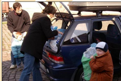
Jako dárci se zapojili také zaměstnanci Charity Opava.