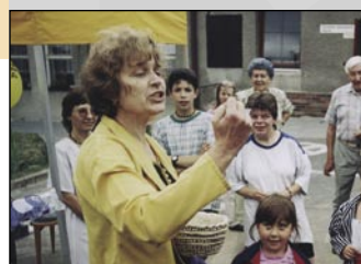
Rozhodnutí bylo a i nadále bude na řediteli. Ten současný umí i střítlet!