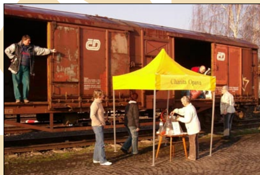
K vagonu bylo možné dojít pěšky i pohodlně přijet autem.

Reakce lidí byly pozitivní: „Je dobře, že tohle děláte, máme spoustu věcí, které už nepotřebujeme. Bylo by škoda je vyhodit.“ Mnozí se ptali, zda budeme sběr opakovat. Charita Opava počítá s tím, že by se sbírka mohla na podzim opakovat. Tahle jarní se třeba stane základem pěkné tradice.