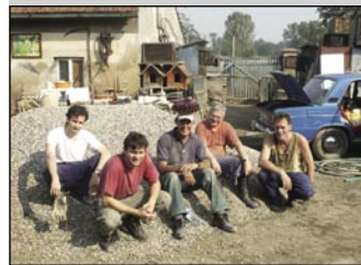
Změny prac. zařazení jsou možná.