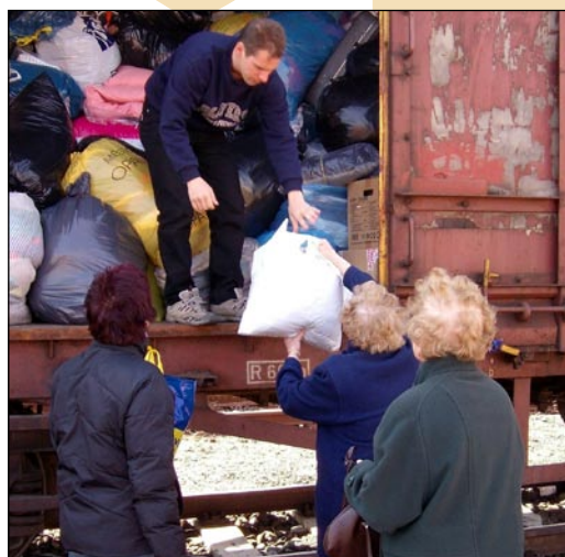
Díky Českým drahám jsme měli k dispozici i druhý vagon.