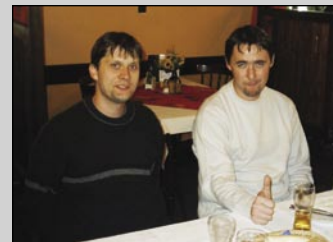
Třeba se za lidi někdo postaví ...