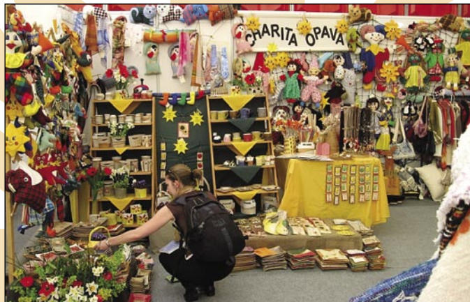
Výrobky klientů se v Praze opravdu líbily

Nejlepší tržby v historii, vysoká návštěvnost, 10x nižší cena za pronájem m2 plochy než u podobných akcí, kvalitní výrobky i profesionalita obsluhujících a v neposlední řadě i reklama dobrému jménu organizace jsou zárukou, že vydatě-li se osobně v roce 2008 na tuto výstavu podívat, Charitu Opava zde určitě potkáte.