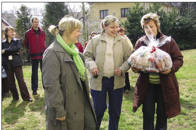
Překvapení od řezníka pro Klub sv. Anežky - první cena v r. 2006