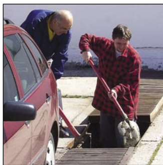
I v r. 2007 se uklízelo opravdu důkladně