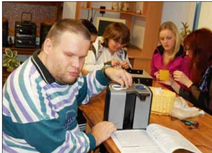
Čtecí přístroj ClearReader si mohli ve Vlastovičkách pořídit i díky finanční pomoci Nadačního fondu Českého rozhlasu ze sbírky Světluška.

Víte, jak zní jednotlivé barvy? Jak se pracuje s vodícím psem pro nevidomé? Jak mluví kuchyňská váha? Odpovědi na tyto a mnohé další otázky mohli loni dostat návštěvníci Obchodního centra Breda&Weinstein. Ve zdejším „Prostoru pro dobrá řešení“, kde probíhají různorodé akce neziskových organizací pro veřejnost, totiž prezentovali zaměstnanci a klienti Domu sv. Cyrila a Metoděje ve Vlastovičkách v rámci Dne nevidomých výuku sociální rehabilitace a předváděli mnoho pomůcek pro zrakově postižené a nevidomé.