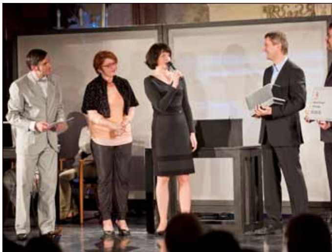
Čekání na slavnostní vyhlášení v budově Senátu Parlamentu ČR stálo zástupce Charity Opava dost nervů – kategorie největší neziskovky se totiž vyhlášovala až úplně poslední. A z úst moderátora nakonec zaznělo: Vítězí Charita Opava!