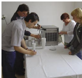
Vyčepováno do poslední kapky