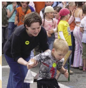
Kdo z nás dvou vyhraje?