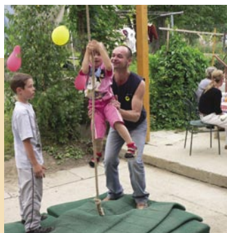
Šplhání po laně je pěkná dřina