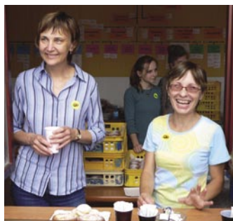
Vyprodáno do posledního drobku