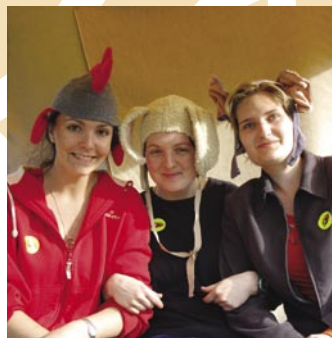
Tři grácie v převleku