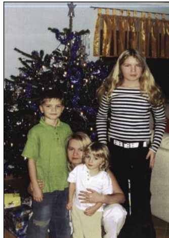
S dětmi o Vánocích