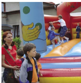
Skákací hrad byl stále obsazen