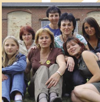
Na Sluníčkovém odpoledni bylo dobře