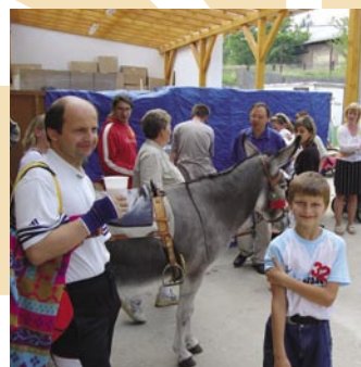
Oslík hledá své stanoviště