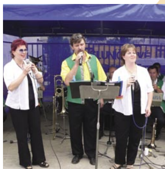
Kobeřanka měla velký úspěch