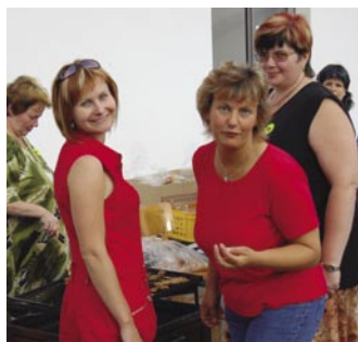
Opravdu už nic nemáme