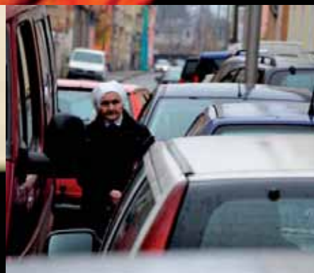
3. kategorie: Jak to vidím já Charita pohledem svých klientů