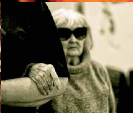
2. kategorie: Život kolem nás Charita pohledem svých zaměstnanců