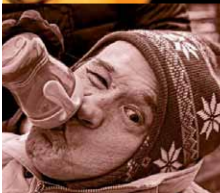
1. kategorie: Portrét Tváře lidí Charity

Patronát nad soutěžní kategorií pro klienty převzala firma ASEKOL.