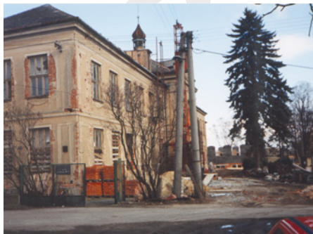
• Takto vypadal dům na začátku rekonstrukce v roce 1994

Dílo sester dominikánek mělo být podle plánu komunistického režimu zlikvidováno a navždy zapomenuto, jejich klášter se postupně měnil v ruinu, které hrozila demolice. Dopadlo to přesně naopak, a je symbolické, že si to v této Vlaštofci můžeme připomenout právě v čase Velikonoc. Pří-