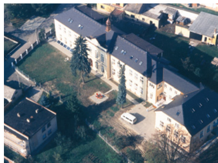
• A takto o dva roky později

běh obnovy, který začal před třiceti lety, má dobrý konec. Někdy to trvá dlouho, ale tma a zmar nakonec budou poraženy. Děkujeme, že jste spolu s námi součástí tohoto úchvatného příběhu.