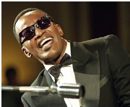
• Ray Charles, ilustrační foto