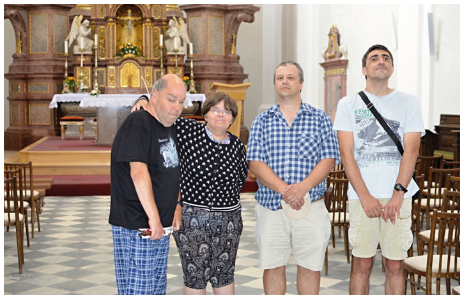
• Při prohlídce konkatedrály Nanebevzetí Panny Marie v Opavě