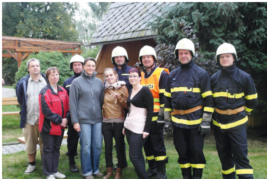
• Momentka z evakuačního cvičení v roce 2015, kterého se zúčastnili také dobrovolní hasiči z Vlašтовиček