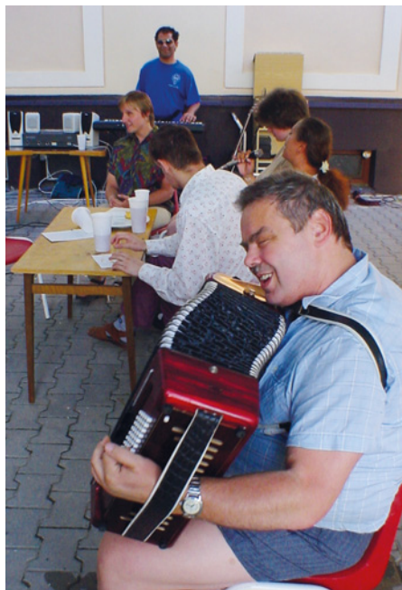
• Na hudební a kulturní složce oslav se v tehdejších letech podíleli zejména sami obyvatelé domu