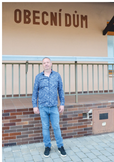
• Pan starosta před obecním domem ve Vlaštovičkách