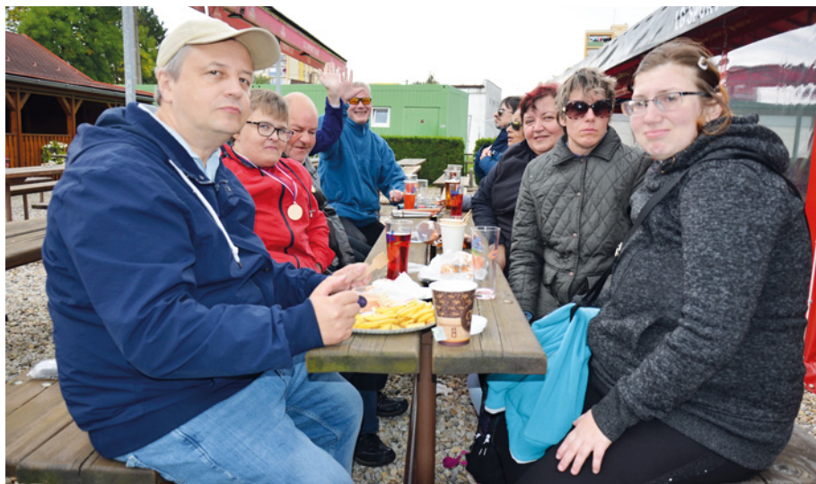
• Posezení a občerstvení obyvatel domu se zaměstnanci při Sportovním dnu