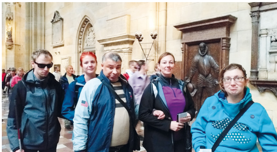
• Obyvatelé spolu se zaměstnankyněmi domu v prostorách pražského hradu

Již hodně let se znám s mým kamarádem Vaškem, který dělá v policejní ochraně v areálu pražského hradu. A protože na společné schůzi obyvatel domu řada lidí projevila zájem pražský hrad navštívit, požádal jsem právě tohoto mého dlouholetého kamaráda, zda-li by byl ochotný nám prohlídku zprostředkovat a po hradě nás navíc provést. Vašek souhlasil a tak jsme mohli začít s plánováním výletu do Prahy.