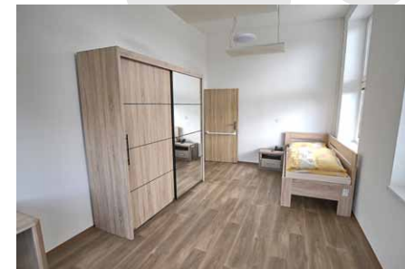
• Byt po rekonstrukci.