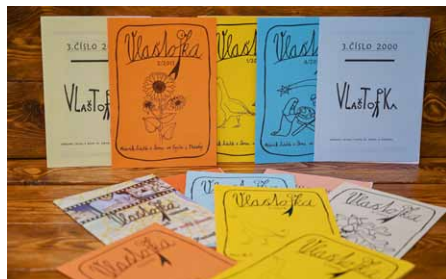
• Vlaštofka během svého vydávání několikrát změnila svůj vzhled.