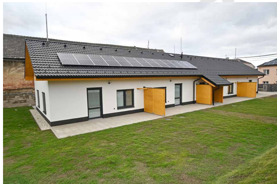
• Celkový pohled na objekt chráněného bydlení pro lidi s mentálním znevýhodněním.

Čtyři nově postavené byty chráněného bydlení pro lidi s mentálním znevýhodněním na Okružní ulici v části Vlaštoviček v Jarkovicích slouží od letošního března klientům Domu sv. Cyrila a Metoděje. Historie vzniku této stavby je velmi zajímavá. Na jejím počátku je velkorysý dar, dar nemovitosti, kterou Charitě Opava věnovali v roce 2017 v závěti manželé Brunclíkoví. Následovaly úvahy a první kroky k rekonstrukci původní stavby, včetně projektové žádosti o finanční podporu Evropské unie, nakonec došlo k demolici původní nemovitosti a výstavbě zcela nového objektu.