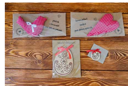
• Drobné dárky, které můžete obdržet po vyluštění křížovky.

Tajenku pošlete na e-mail vlastovicky@charitaopava.cz nejpozději do 15. 5. 2024. Pod tajenku nezapomeňte uvést adresu, na kterou bychom mohli poslat případnou výhru. Výherce bude odměněn dárečkem na obrázku.