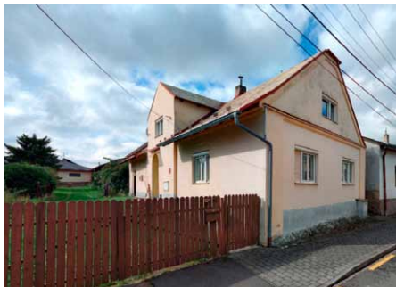
• Původní nemovitost v roce 2017.

ritě rozhodli odkázat svůj rodinný dům i přílehlou zahradu.