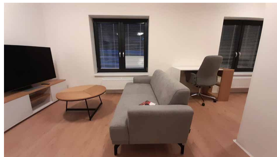
• Interiér jednoho ze čtyř nových bytů.