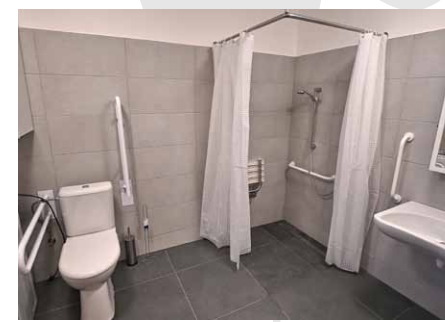
• Sociální zařízení v jednom z bytů.

kteří potřebují k samostatnému životu podporu sociální služby chráněné bydlení. Podporu jim budou ve stanoveném rozsahu zajišťovat pracovníci nedalekého Domu sv. Cyrila a Metoděje, s jejichž pomocí by měl každý klient získat potřebné dovednosti a znalosti, které mu umožní bydlet samostatně a pečovat o svou osobu ve vlastní samostatné domácnosti.