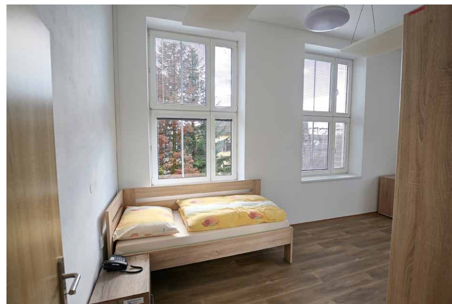
• Upravené prostory zrekonstruovaného bytu.