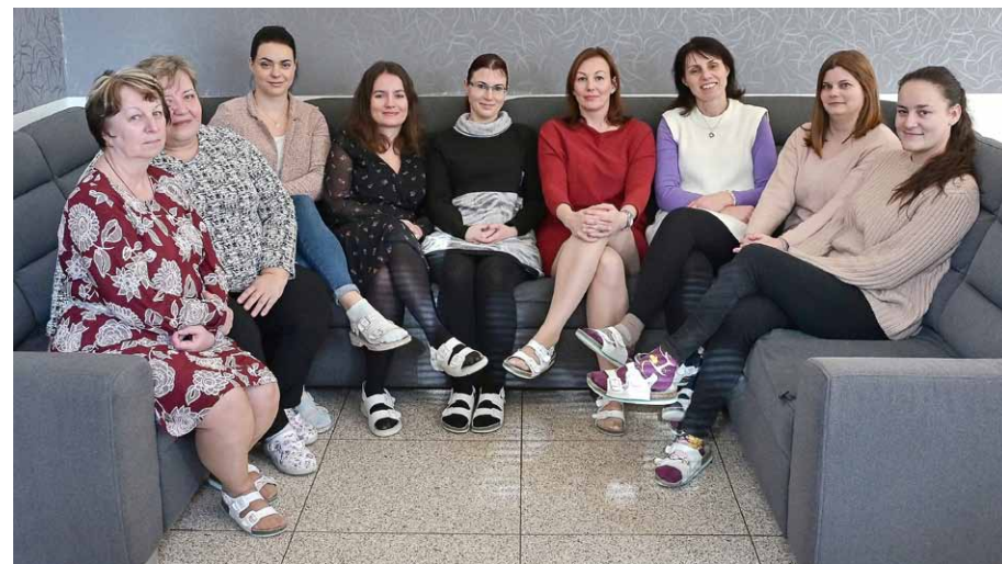
• Zaměstnankyně chráněného bydlení ve Vlastovičkách.

Je to práce s lidmi, kteří nás potřebují, a mám ohromnou radost, když je klient spokojený a umí sám žít svůj vlastní život.