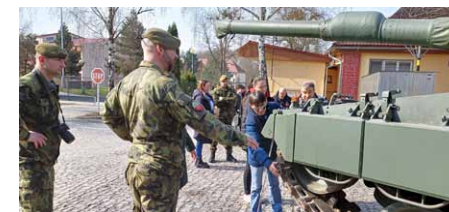
• Veškerou vojenskou techniku si mohli klienti osahat.