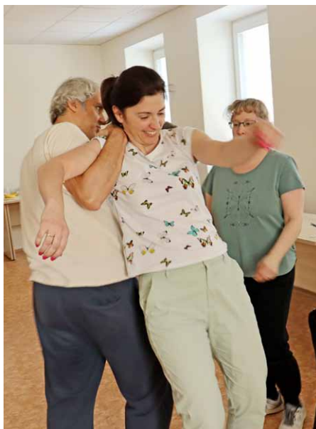
• Pracovníci Charity Opava během aktivního nácviku šetrné sebeobran.

Velká skupina pracovníků Charity Opava pracujících v sociálních službách s klienty s potenciálním rizikem v chování, absolvovala v minulých dnech školení. To mělo přispět k posílení bezpečnosti pracovníků při zvládnání náročných situací souvisejících s agresivním projevem osoby, které pracovník v daný moment poskytuje sociální službu. Vítanou součástí byl praktický nácvik základních technik šetrné se-