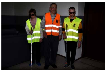
• Reflexní vesty a další reflexní prvky výrazně snižují za zhoršené viditelnosti míru rizika.