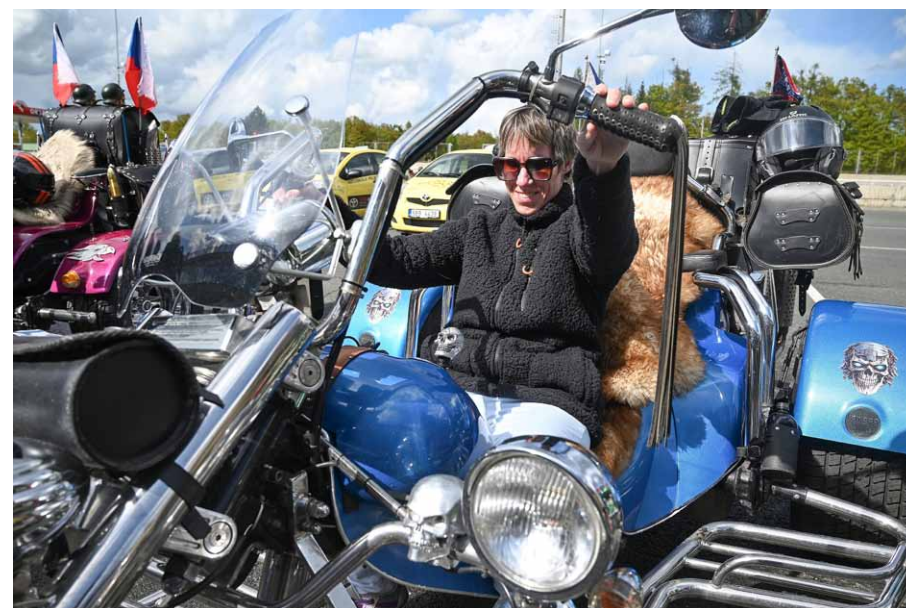
• Všichni přítomní si mohli osahat velké mašiny a kdo měl odvalu, mohl se svést jako spolujezdec na takové motorce přímo na automotodromu.