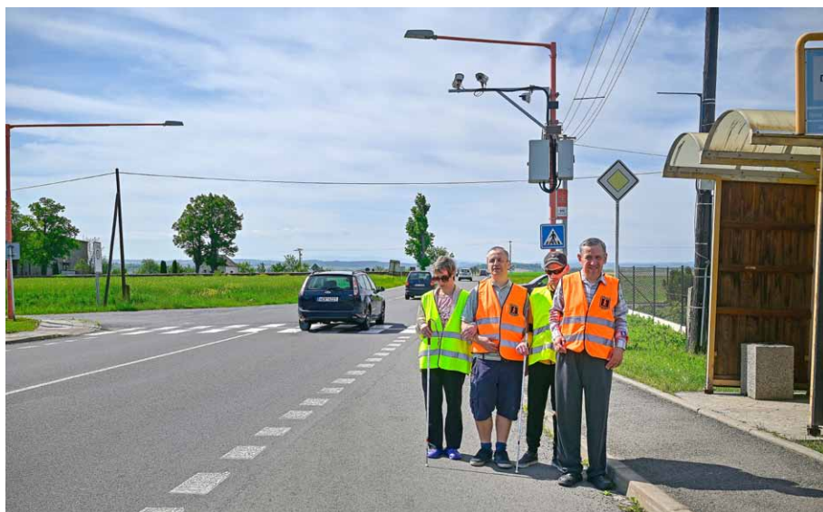
• Obyvatelé domu s doprovodem před přechodem na hlavní silnici ve Vlašovičkách, kde byl nedávno instalován dopravní radar.