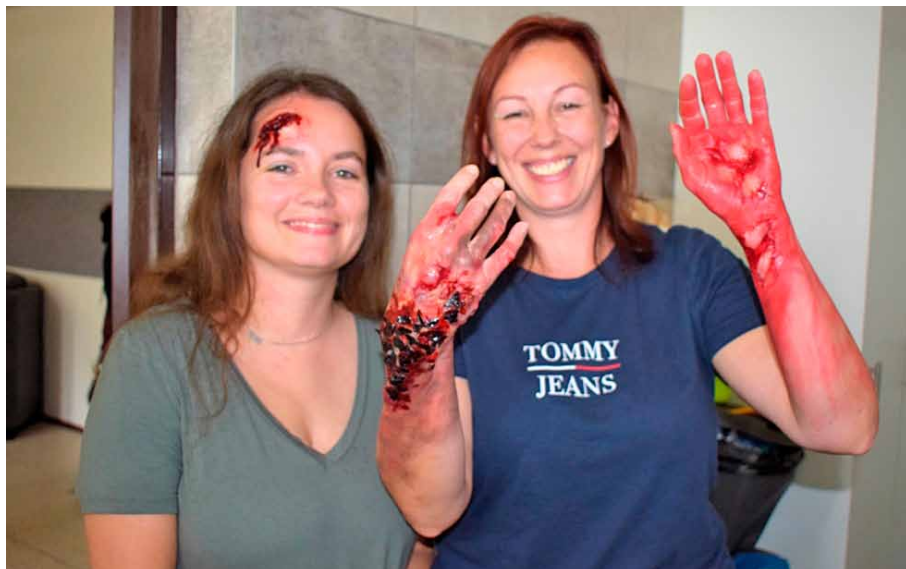
• Namaskování zranění bylo u zaměstnankyň domu u posledního cvičení velmi realistické.

Když vypukne požár v budově, ve které žije více lidí, je zásah pro požárníky vždy logisticky velmi náročný. Ovšem daleko složitější situace nastává tehdy, když vypukne požár v domě, ve kterém žije více lidí s nějakým handicapem znesnadňujícím evakuaci, orientaci v prostoru nebo komunikaci. I proto probíhají v Domě sv. Cyrila a Metoděje pro zrakově postižené pravidelná požární cvičení, která mají hasiče i obyvatele domu na tuto situaci připravit.