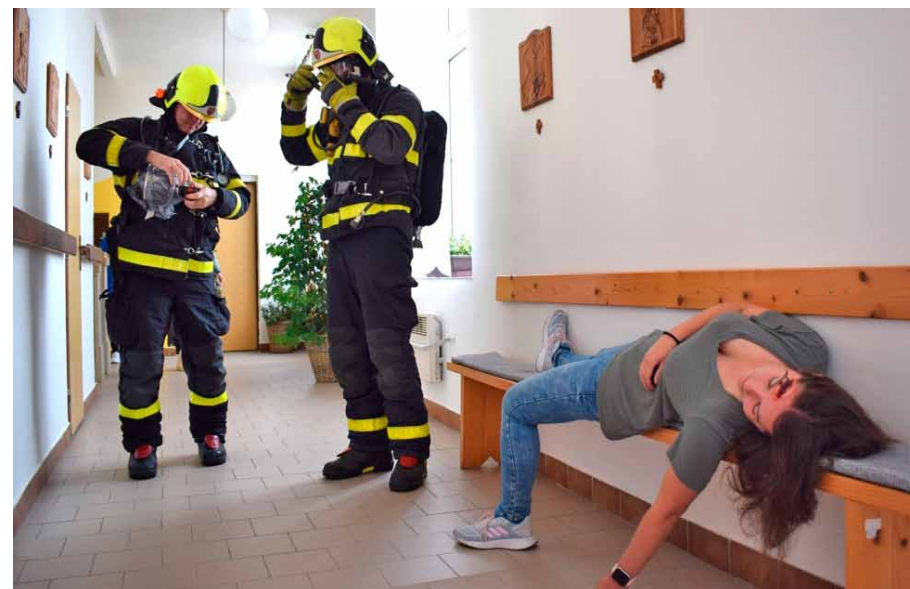
• Zásahové jednotky i figuranti z řad zaměstnanců svou úlohu během cvičení zvládli.