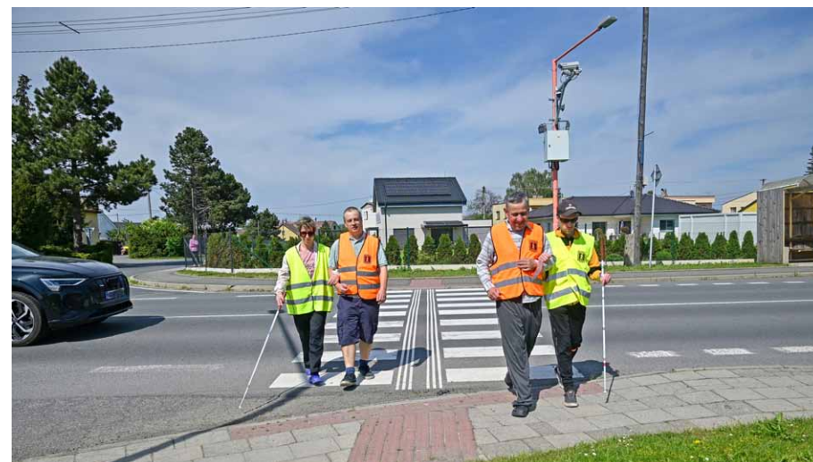
• Pro řadu obyvatel domu bylo přejít přes frekventovanou silnici ve Vlastovičkách ještě donedávna téměř adrenalinovým zážitkem.

Efekt je neskutečný, mám jen kladné reference. Snížením rychlosti začali projíždějící řidiči bezproblémově za-