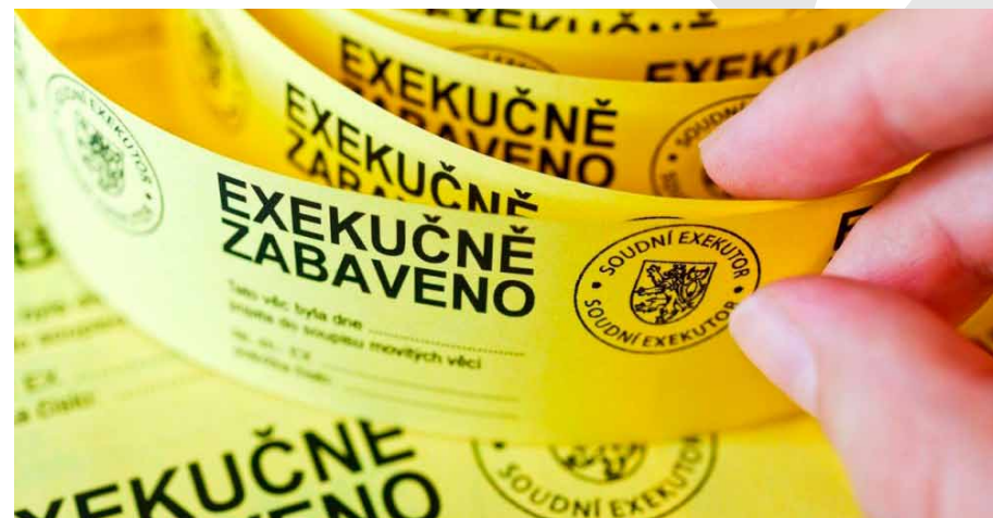
• Ilustrační foto.

Mezi nebezpečími, která nám hrozí, je i možnost spadnout do pastí exekucí. Řada lidí, kteří se ocitnou ve složité finanční situaci, si totiž vezme úvěr u nebankovní společnosti. A až poté zjistí, že si společnost účtuje nepřiměřeně vysokou odměnu. Pokud potřebují pomoc, mohou se obrátit na finančního arbitra.