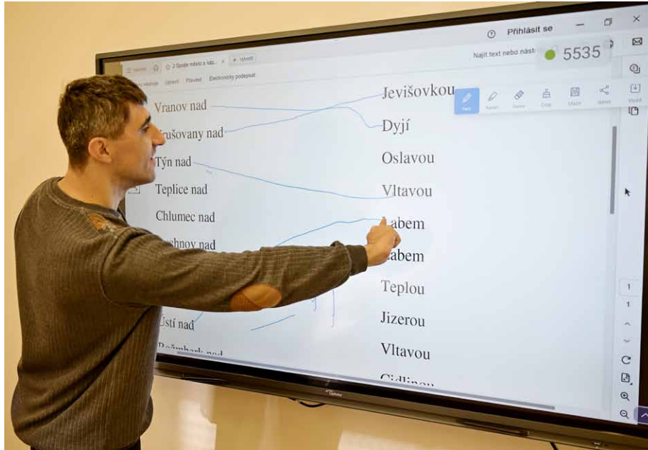
• V rámci služby sociální rehabilitace je multifunkční tabule často využívanou pomůckou.

Jak naši příznivci jistě vědí, Dům sv. Cyrila a Metoděje pro zrakově postižené ve Vlastovičkách byl otevřen 29. září roku 1996. Tehdejší komunitní bydlení sloužilo výhradně lidem s těžkým zrakovým postižením, lidem slabozrakým a nevidomým. Milníkem pro naše bydlení byl rok 2006, kdy vešel v platnost zákon 108/2006 Sb., o sociálních službách, který ukládá poskytovatelům sociálních služeb povinnost registrace. Dle tohoto zákona jsme v našem domě registrovali dvě sociální služby – chráněné bydlení a sociální rehabilitaci. V roce 2008 jsme také rozšířili okruh osob, kterým se v našich službách věnujeme. Vedle skupiny zrakově postižených osob se v našich službách věnujeme také lidem s lehkým mentálním znevýhodněním. Obě služby až dosud užívají jeden název. A protože původní název, který naše služby používají dvacet osm let, již dobře nevystihuje jejich poslání, rozhodli jsme se od 1. 1. 2025 chráněné bydlení i sociální rehabilitaci nově pojmenovat.