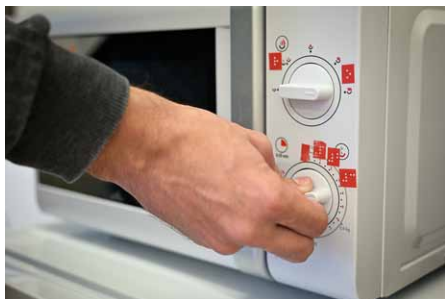
• Uživatelé si některé z pomůcek označují braillovým písmem.