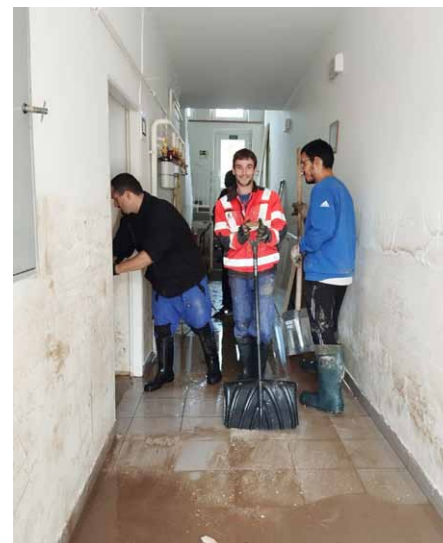
• Při vyklízení zaplavených bytů pomáhali i sami obyvatelé Vlačtoviček.

V září letošního roku zasáhly část naší země ničivé povodně. Opavsko bylo mezi nejpostiženějšími místy, kde voda zdevastovala mnoho domovů. Mezi jinými i naše byty chráněného bydlení na ulici U Trojice. Původně klidné místo k bydlení nedaleko městských sadů, na kterém se nachází čtyři byty chráněného bydlení ve dvoupodlažním bytovém domě, se v neděli 15. září stalo součástí povodňové oblasti o rozsahu 10 km 2 .