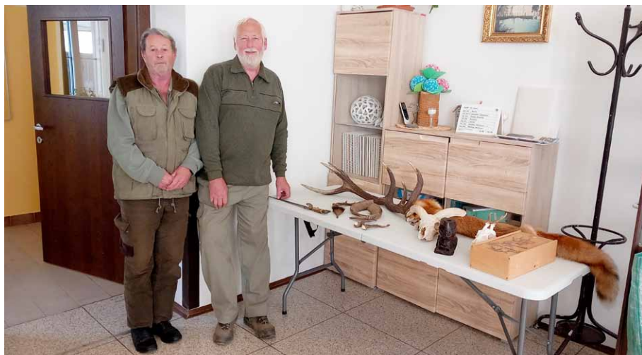
• V průběhu října si obyvatelé domu užili přednášku o myslivosti, kde si mohli prohlédnout a osahat řadu zajímavých exponátů.