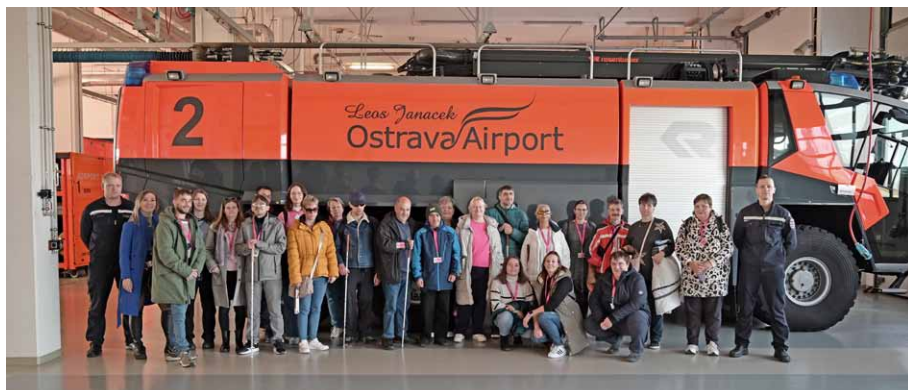
• Obyvatelé domu navštívili na ostravském letišti mimo jiné i hasičský záchranný sbor.

Pracovníci společně s klienty navštívili letiště Leoše Janáčka v Ostravě Mošnově. Zde se dozvěděli, že oficiálně byl letový provoz zahájen v roce 1959 a provozovatelem tohoto civilního letiště je Letiště Ostrava, a.s. Z letiště Leoše Janáčka v Ostravě odlétají letadla v pravidelných nebo nepravidelných (tzv. charterových) letech do různých míst. Ty pravidelné lety jsou v tomto období např. do Londýna nebo Varšavy. Ty charterové pak bývají např. do Řecka, Bulharska, Španělska, Tuniska, Turecka a mnoha dalších zemí. Pro odbavení cestujících k letu slouží na letišti třináct přepážek.