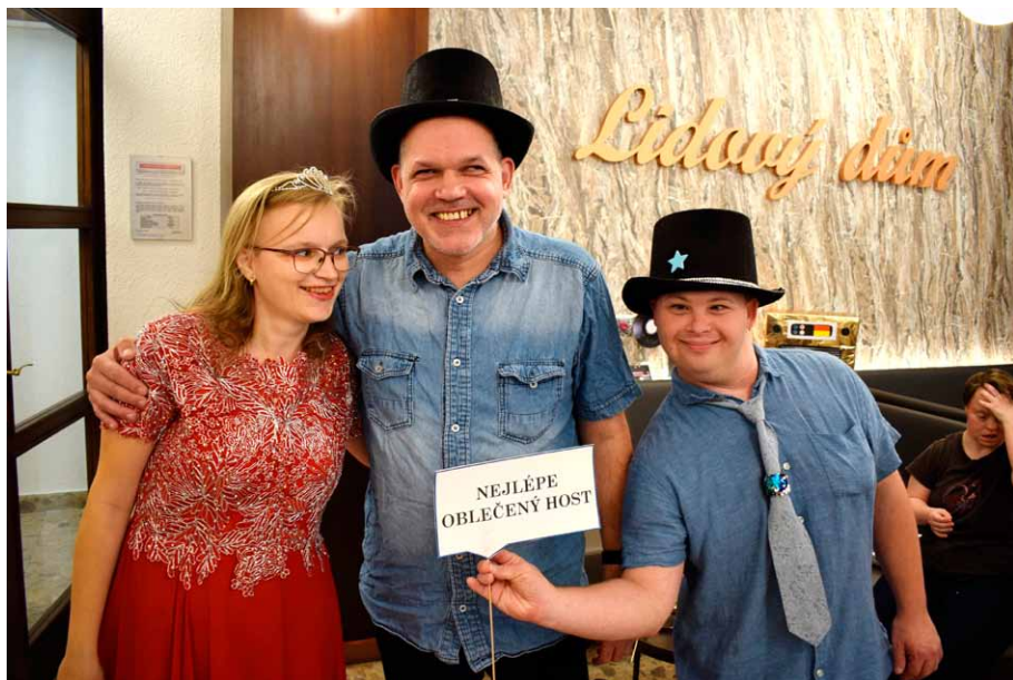
• Účastníci letošního plesu Charity Opava si atmosféru nadmíru užívali.